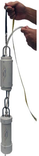
Aardvark permeameter module en drukregelaar