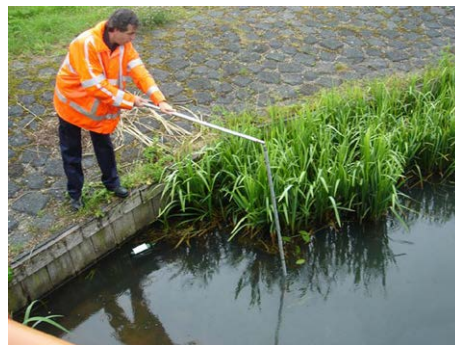
Gebruik van slibbaak met elleboogstuk